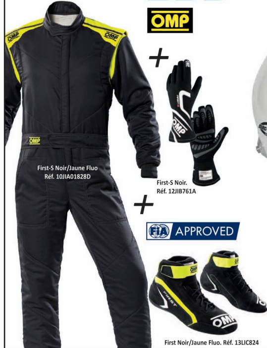
First-S Noir/Jaune Fluo Réf. 10JIA01828D