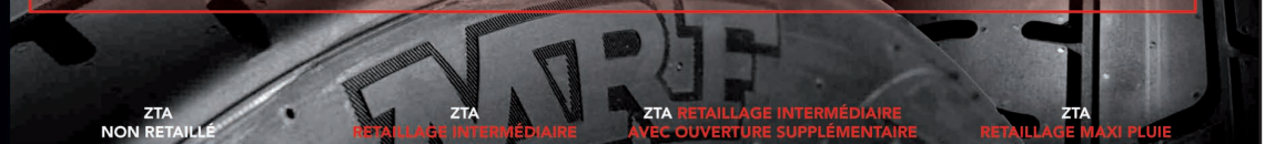
ZTA NON RETAILLE

Conçu pour les rallyes sur asphalte, le pneu MRF ZTA est conforme aux dernières réglementations de la FIA. Son dessin asymétrique, sa carcasse supérieure et ses flancs assurent une meilleure tenue de route et une meilleure traction sur le sec comme sur le mouillé.