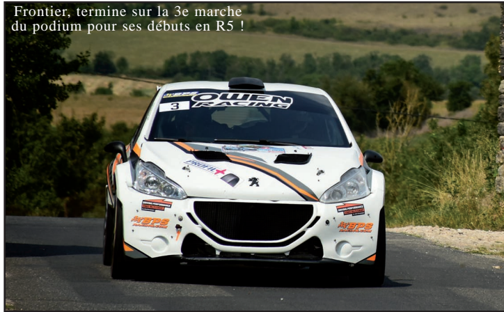
Frontier, termine sur la 3e marche du podium pour ses débuts en R5 !