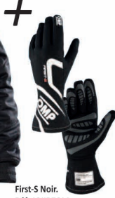
First-S Noir. Réf. 12JIB761A