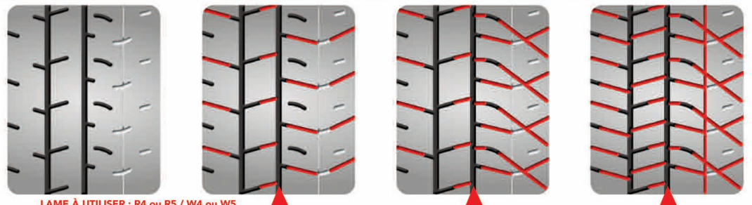
LAME À UTILISER : R4 ou R5 / W4 ou W5