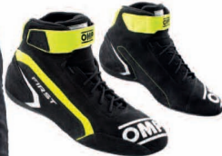
First Noir/Jaune Fluo. Réf. 13LIC824

CASQUE BELL 2021 MAG-10 RALLY PRO (HANS) FIABBS9/SA2020